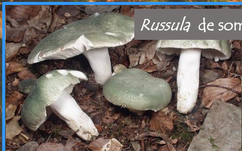
Russula de sombrero verde